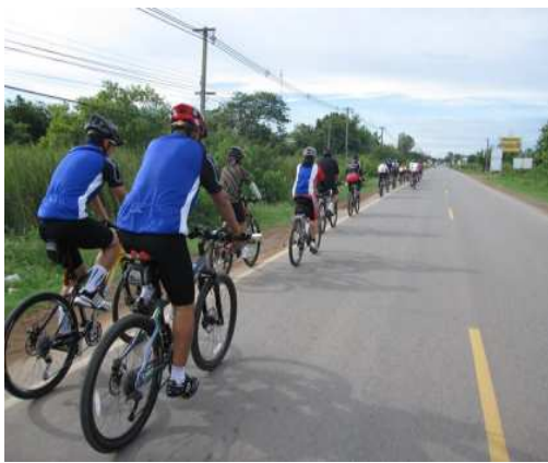
จัดกิจกรรมการกีฬา ออกกำลังกายเพื่อรักษาสุขภาพให้แข็งแรง สถานีวิจัยทดสอบพันธุ์สัตว์พิษณุโลก