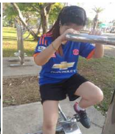
จัดอบรม เรื่อง ทำงานอย่างไรให้มีความสุข เชิญชวนเจ้าหน้าที่ออกกำลังกายหลังเลิกงาน สำนักงานปศุสัตว์จังหวัดจันทบุรี