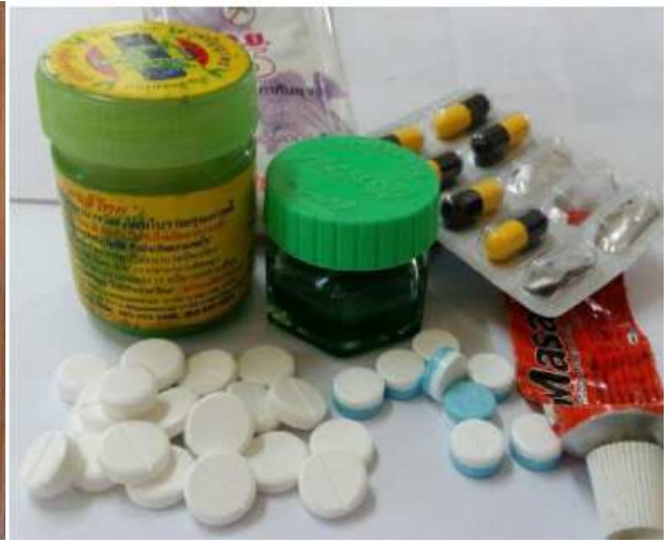
กิจกรรมรักษาพยาบาลเบื้องต้น จัดให้มีตู้ยาสามัญประจำบ้าน ด้านกักกันสัตว์ไฮสตร