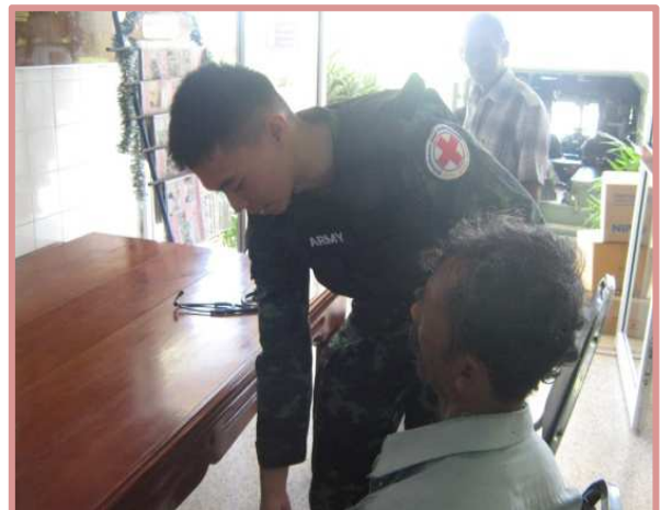
การให้ความรู้ด้านสุขภาพการรักษาพยาบาลเบื้องต้นมีตู้ยาประจำสำนักงานมีการตรวจและดูแลสุขภาพ สถานีวิจัยทดสอบพันธุ์สัตว์เทพา