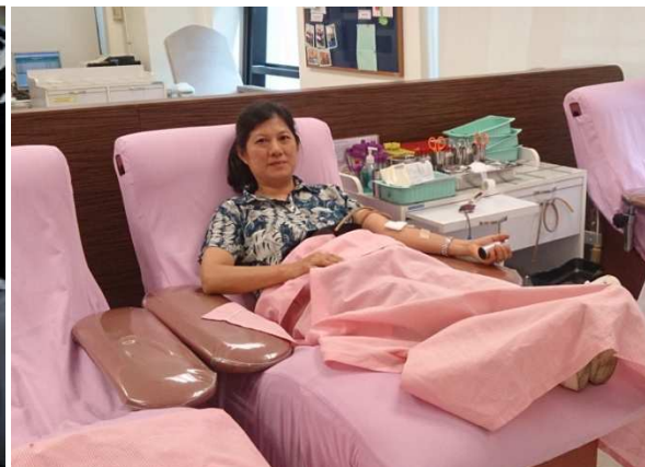
กิจกรรมตรวจสุขภาพประจำปี และกิจกรรมบริจาคโลหิต สถาบันสุขภาพสัตว์แห่งชาติ