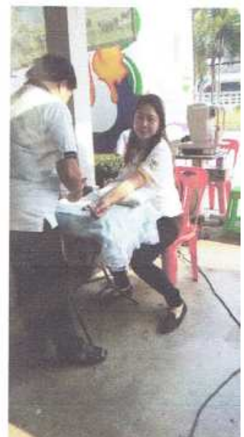
ตรวจสอบภาพประจำปี ๒๕๕๙ สำนักงานปศุสัตว์จังหวัดกาญจนบุรี