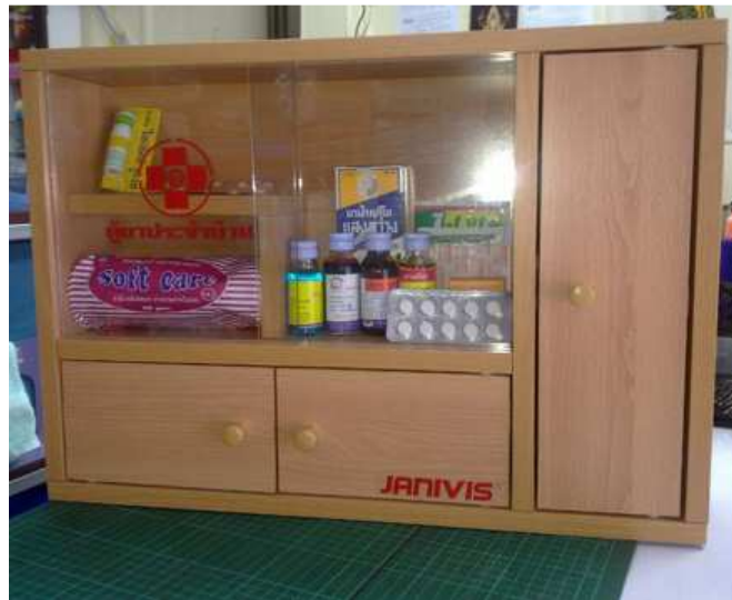
กิจกรรมด้านมีชีวิตชีวา-แผนการรักษาพยาบาลเบื้องต้น สำนักพัฒนาระบบและรับรองมาตรฐานสินค้าปศุสัตว์