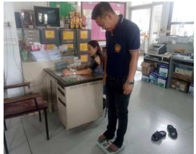
ตรวจและดูแลสุขภาพประจำปี วัดความดันโลหิตและประเมินภาวะโรคอ้วน