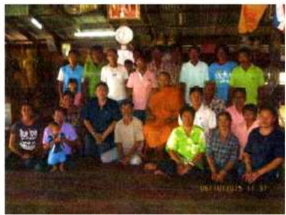
กิจกรรมทำความดีถวายในหลวง ศูนย์วิจัยและพัฒนาการปศุสัตว์ที่ ๒