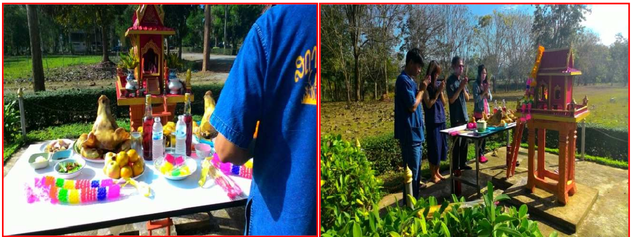
เลี้ยงศาลพระภูมิเจ้าที่ดำเนินการจัดงานช่วงในเทศกาลวันขึ้นปีใหม่ สถานีพัฒนาอาหารสัตว์จังหวัดแพร่