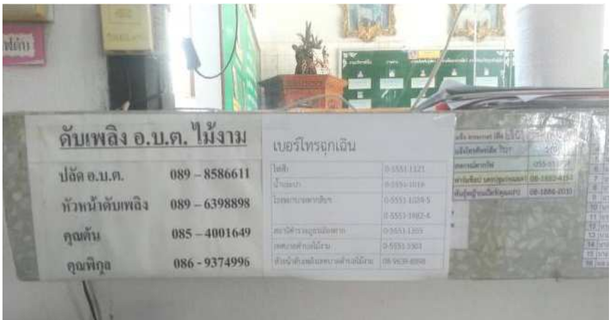
มีเบอร์โทรศัพท์ฉุกเฉิน