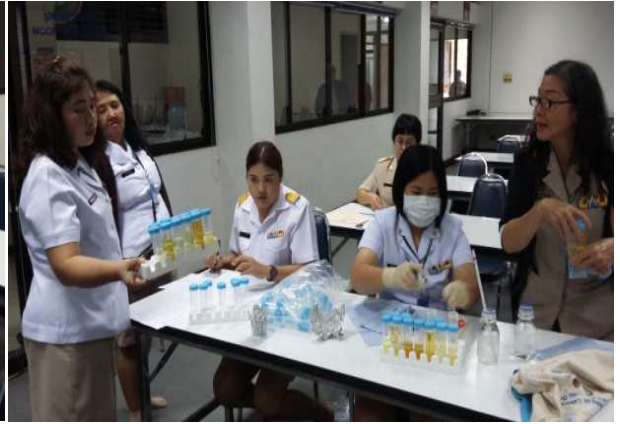
จัดกิจกรรมตรวจสุขภาพ สำนักตรวจสอบคุณภาพสินค้าปศุสัตว์