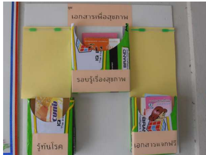
มีมุมความรู้ ให้ความรู้ด้านสุขภาพ