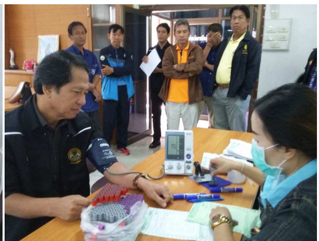
ตรวจสุขภาพประจำปี สำนักงานปศุสัตว์จังหวัดกาฬสินธุ์