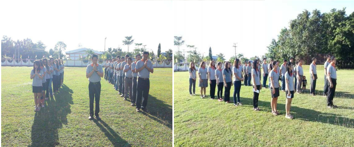
กิจกรรมเข้าแถวเคารพธงชาติ หน้าเสาธง สำนักงานปศุสัตว์จังหวัดสระแก้ว