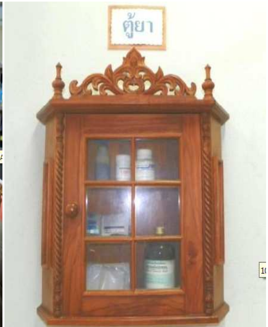
การให้ความรู้ด้านสุขภาพ จัดให้มีตู้ยา สามัญประจำสำนักงานไวยามฉุกเฉิน ศูนย์วิจัยและบำรุงพันธุ์สัตว์ตาก