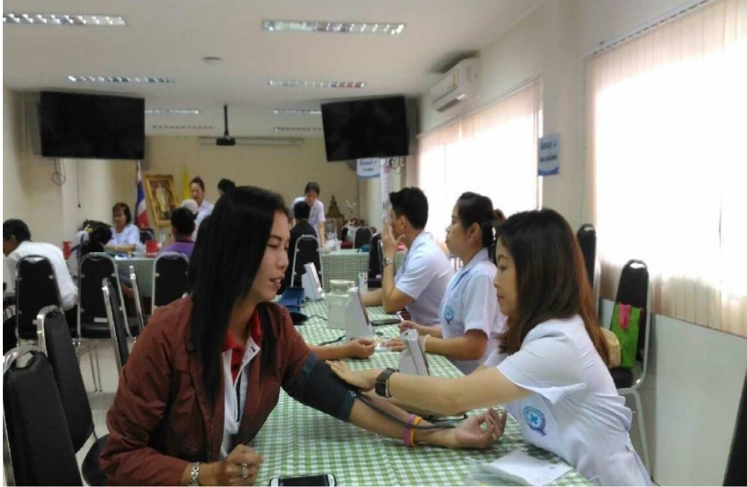
กิจกรรมตรวจสอบสุขภาพ สำนักตรวจสอบคุณภาพสินค้าปศุสัตว์