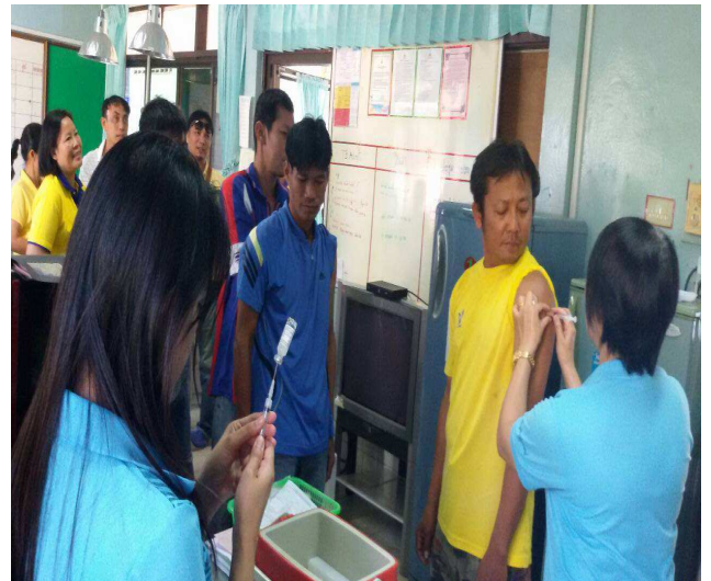
การตรวจและดูแลสุขภาพ โดยการนำเจ้าหน้าที่ฉีดวัคซีนไขหวัดใหญ่ที่โรงพยาบาลหนองบัว สถานีวิจัยทดสอบพันธุ์สัตว์นครสวรรค์