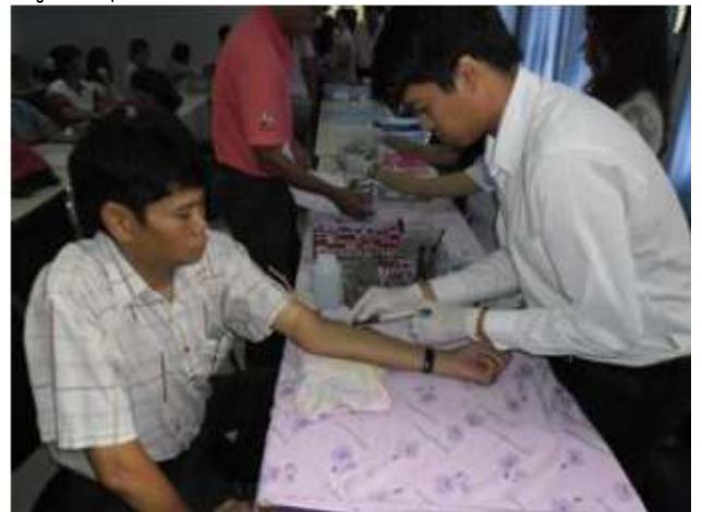
ข้าราชการ ลูกจ้างประจำ พนักงานราชการ และพนักงานจ้างเหมาฯ ได้รับบริการฉีดวัคซีนป้องกันโรคไข้หวัดใหญ่ประจำปี สำนักงานปศุสัตว์จังหวัดตรัง