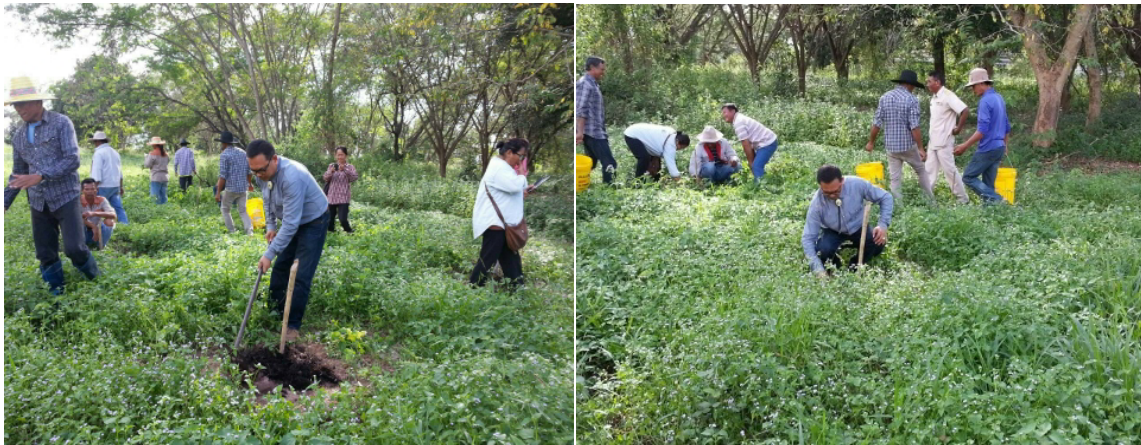
กิจกรรมด้านมีชีวิตชีวา สถานีวิจัยทดสอบพันธุ์สัตว์ปรีรัมย์