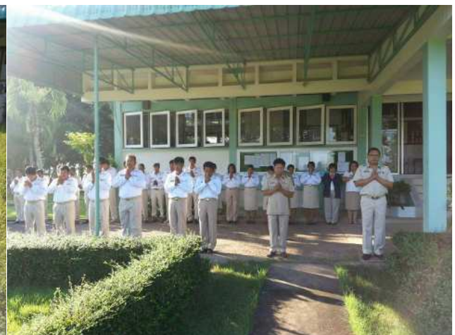
กิจกรรมด้านมีชีวิตชีวา