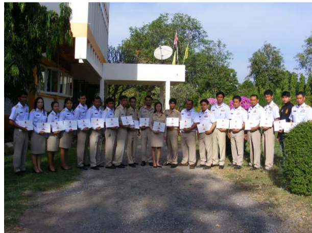
กิจกรรมกระโดดหอ โดยการนำข้าราชการและเจ้าหน้าที่เข้ารับการฝึกอบรม ทดสอบกำลังใจกระโดดหอสูง ๓๔ ฟุต ที่ค่ายทหารจิระประวัตี จังหวัดนครสวรรค์ สถานีวิจัยทดสอบพันธุ์สัตว์นครสวรรค์