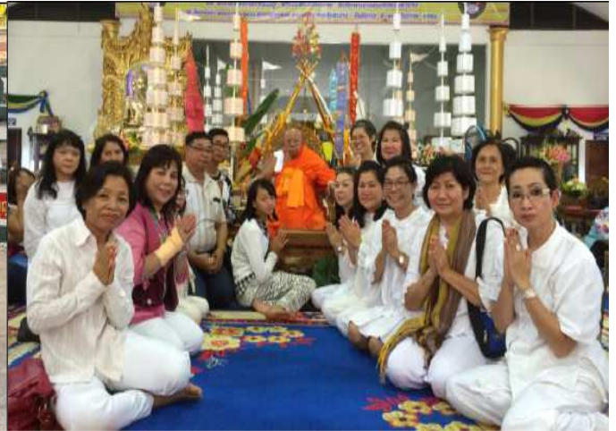
เจ้าหน้าที่ร่วมทำบุญ ปฏิบัติธรรมตามโอกาส ศูนย์วิจัยและพัฒนาอาหารสัตว์ลำปาง