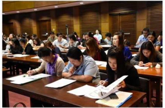
การอบรมสัมมนา สถาบันสุขภาพสัตว์แห่งชาติ