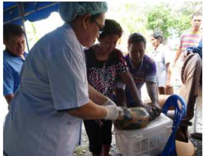
ออกหน่วยบริการตอน-ทำหมันสุนัข และแมว ทุกเดือน เสริมสร้างความสัมพันธ์ระหว่างเจ้าหน้าที่และเกษตรกร สำนักงานปศุสัตว์จังหวัดตรัง