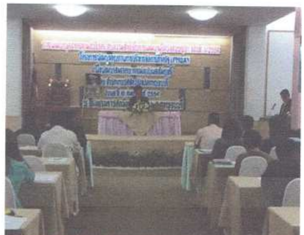
โครงการอบรมสัมมนา สำนักงานปศุสัตว์จังหวัดกาญจนบุรี