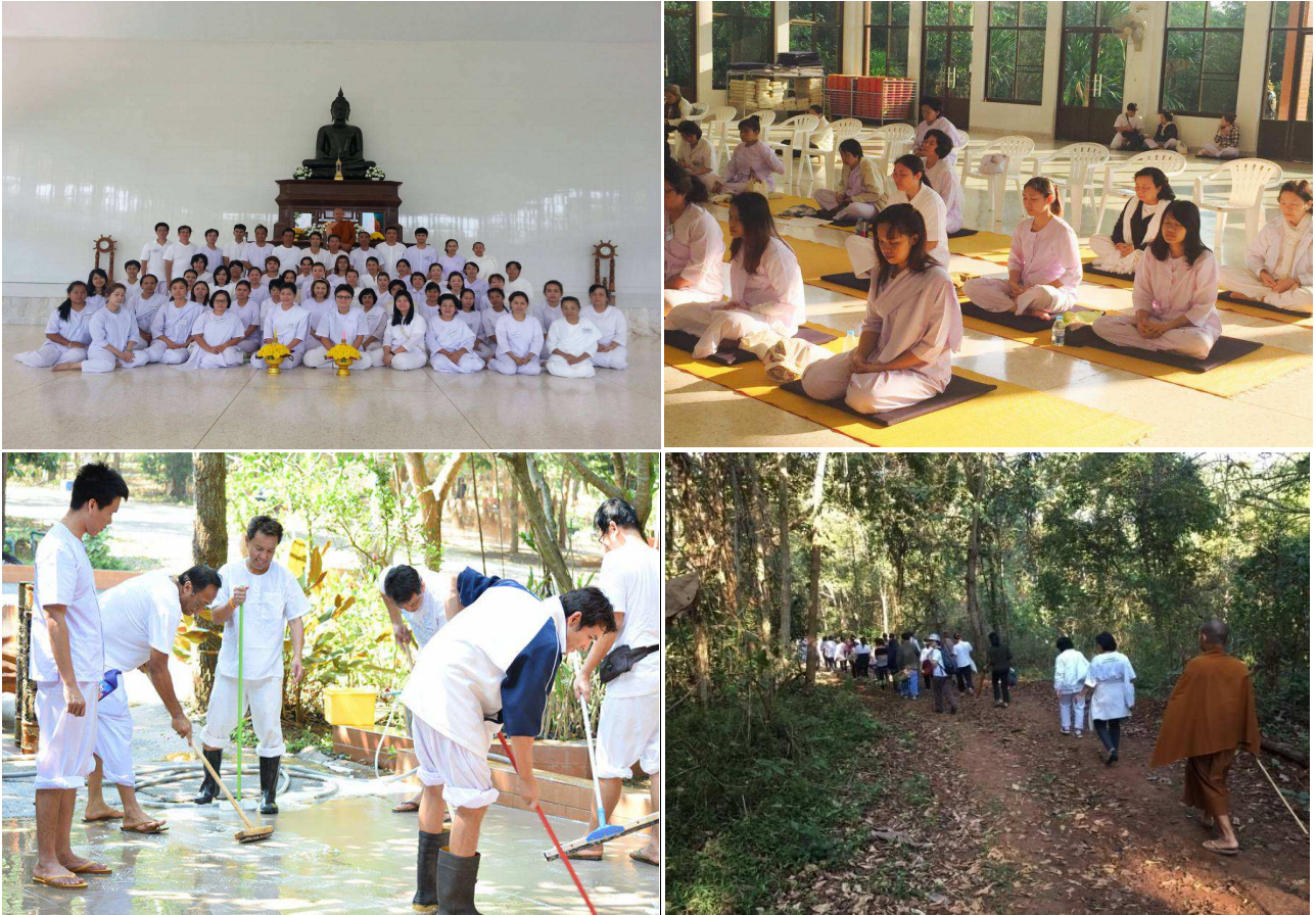
กองการเจ้าหน้าที่เข้าร่วมโครงการพัฒนาคุณธรรมจริยธรรมเพื่อเสริมสร้างคุณภาพชีวิตและประสิทธิภาพการทำงาน ปี ๒๕๕๙ รุ่นที่ ๑๕ ระหว่าง วันที่ ๒๕-๓๑ มกราคม ๒๕๕๙