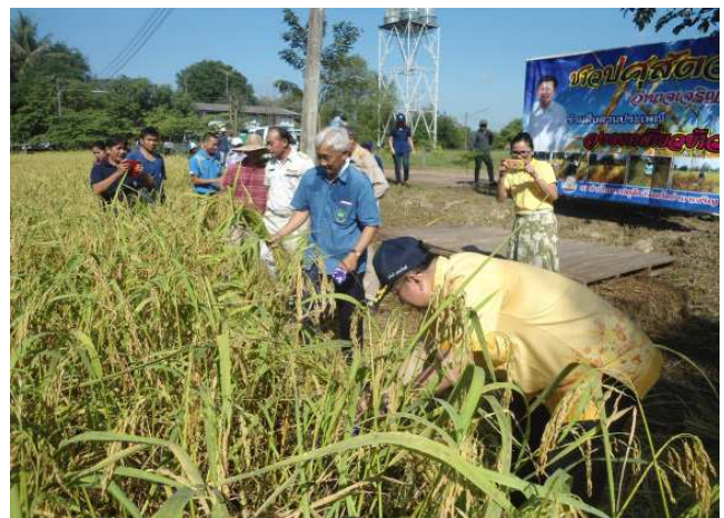
ดำเนินการตามแนวเศรษฐกิจพอเพียงใช้พื้นที่ว่างเปล่าให้เกิดประโยชน์สูงสุด สำนักงานปศุสัตว์จังหวัดอำนาจเจริญ