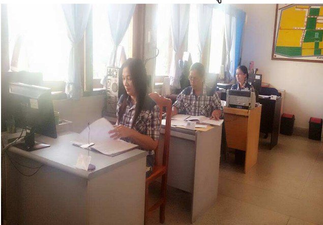
วันพฤหัสบดี เสื้อลายสก๊อต