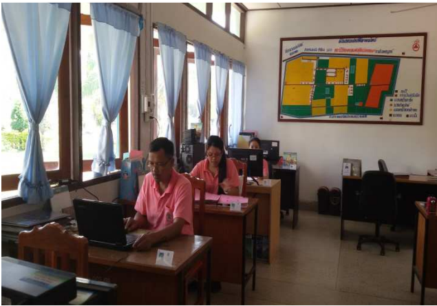
วันอังคาร เสื้อสีชมพู