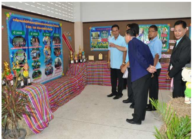
กิจกรรมจิตอาสาโครงการสัตวแพทย์พระทาน ณ อำเภอมหาชนะชัย จังหวัดยโสธร สำนักงานปศุสัตว์จังหวัดยโสธร