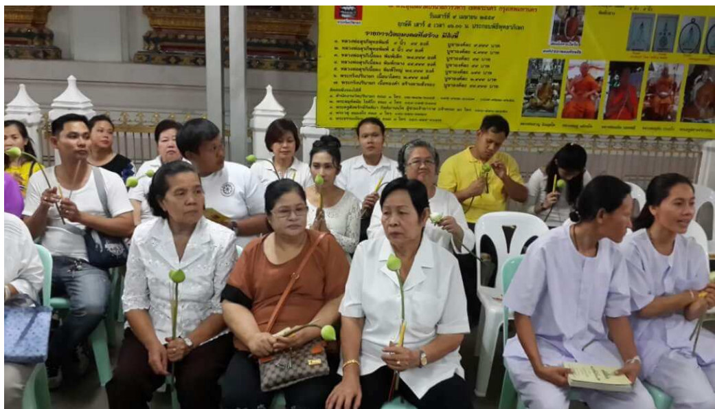
กิจกรรมด้านมีชีวิตชีวา-แผนงานส่งเสริมคุณภาพชีวิต สำนักพัฒนาระบบและรับรองมาตรฐานสินค้าปศุสัตว์