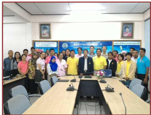
ส่งเจ้าหน้าที่เข้ารับการฝึกอบรมอย่างต่อเนื่อง สถานีวิจัยทดสอบพันธุ์สัตว์เทพา