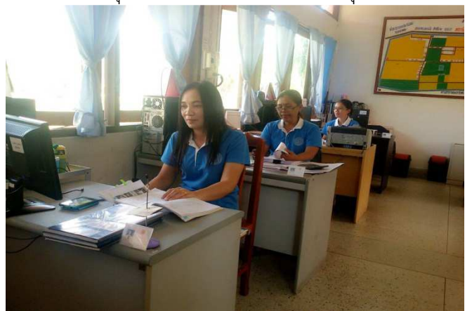
วันศุกร์ เสื้อสีฟ้ากระทรวงเกษตร

โครงการสร้างจิตสำนึกในการแต่งกายเครื่องแบบราชการ และการแต่งกายตามวัน เช่น วันจันทร์ เครื่องแบบข้าราชการ ลูกจ้างประจำ พนักงานราชการ สถานีวิจัยทดสอบพันธุ์สัตว์นครสวรรค์