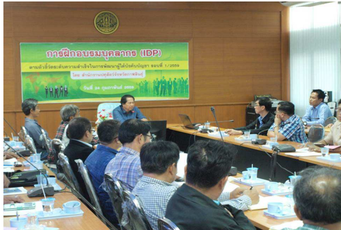
การอบรมบุคลากร สำนักงานปศุสัตว์จังหวัดกาฬสินธุ์