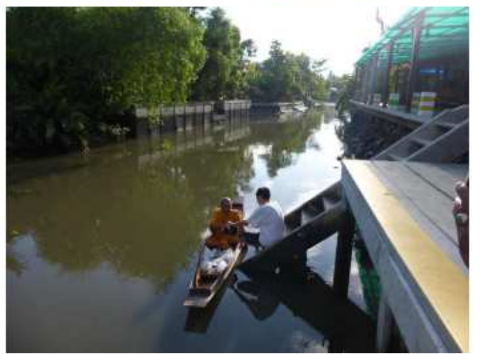
เจ้าหน้าที่ร่วมทำบุญตักบาตรตอนเช้า เพื่อเป็นสิริมงคลแก่ชีวิต