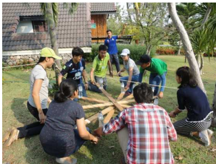
ประชุมสัมมนา สำนักงานปศุสัตว์ เขต ๑