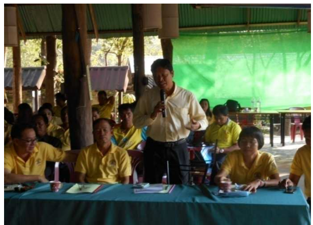
ด้านการพัฒนาบุคลากร การอบรมพัฒนาบุคลากร : ระดับความสำเร็จในการพัฒนาผู้ได้บังคับบัญชา รอบที่ ๑/๒๕๕๙ สำนักงานปศุสัตว์จังหวัดยโสธร