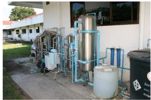
เครื่องกำเนิดไฟฟ้าสำรองระบบกรองน้ำและระบบน้ำประปา