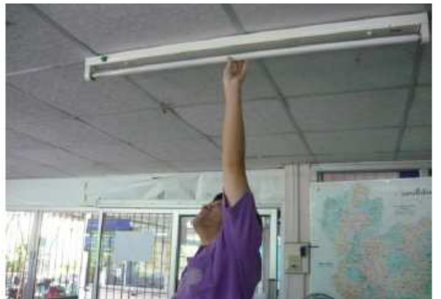
รวมถึงหลอดไฟให้ใช้งานได้และให้แสงสว่างที่เพียงพอ สำนักงานปศุสัตว์จังหวัดจันทบุรี