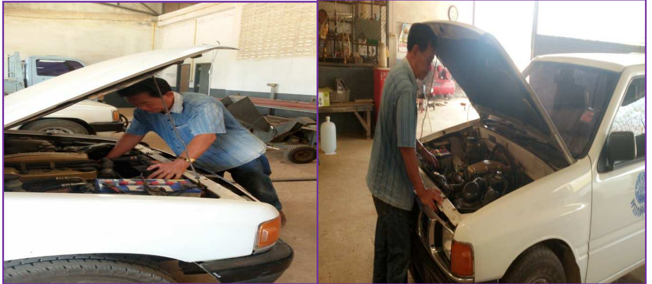
ดูแล ซ่อม บำรุงรักษายานพาหนะ สถานีพัฒนาอาหารสัตว์จังหวัดแพร่