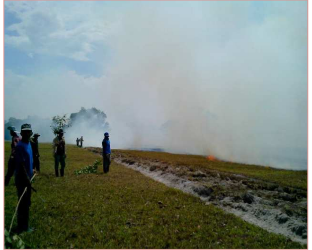
ทำแนวกันไฟเพื่อป้องกันไฟไหม้ สถานีวิจัยทดสอบพันธุ์สัตว์เทพา