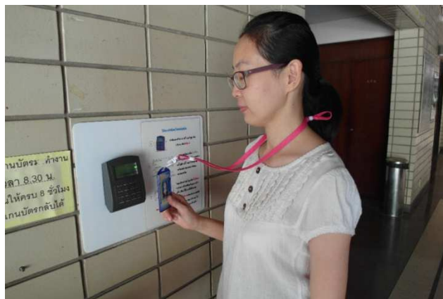
ติดตั้งระบบคีย์การ์ด สถาบันสุขภาพสัตว์แห่งชาติ