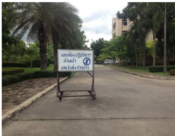
มีป้ายบอกจุดและตำแหน่ง ชัดเจน สถาบันสุขภาพสัตว์แห่งชาติ