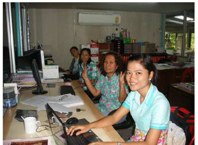
ตรวจสอบการใช้งานคอมพิวเตอร์ ตรวจสอบอุปกรณ์และซ่อมแซมอุปกรณ์คอมพิวเตอร์ ศูนย์วิจัยและพัฒนาการปศุสัตว์ที่ ๑