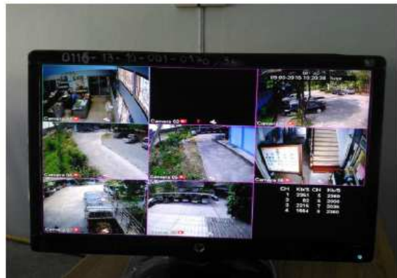
จัดเวรยามให้เจ้าหน้าที่และติดตั้งกล้องวงจรปิดเพื่อดูแลความปลอดภัยให้แก่สำนักงาน