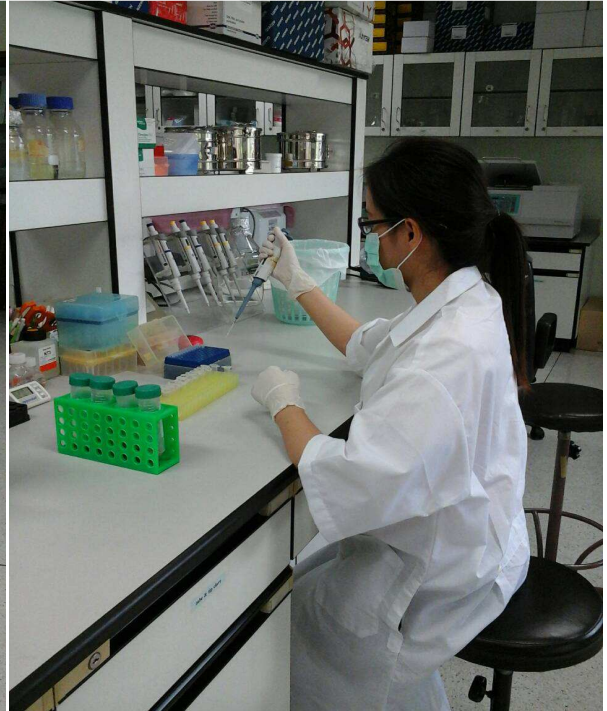
การปฏิบัติงานในห้อง lab ต้องแต่งกายให้มิดชิด เพื่อความปลอดภัยจากสารเคมี สำนักเทคโนโลยีชีวภาพการผลิตปศุสัตว์(สทป.)