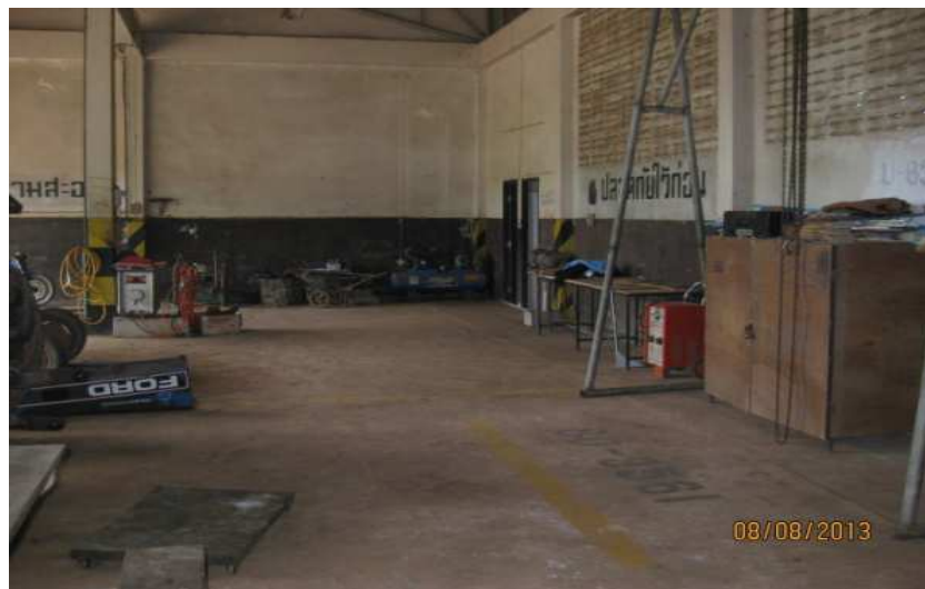
งานซ่อมบำรุงรักษา ตรวจเช็คอุปกรณ์ และการจัดระบบการจัดเก็บเครื่องมือ สถานีวิจัยทดสอบพันธุ์สัตว์พิษณุโลก