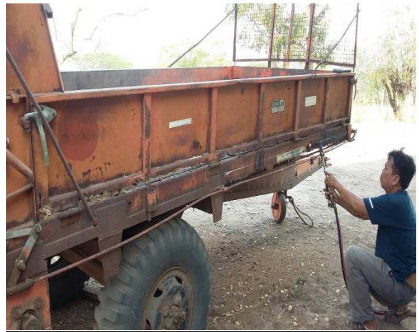
งานซ่อมบำรุงยานพาหนะ และเครื่องจักรกลการเกษตร