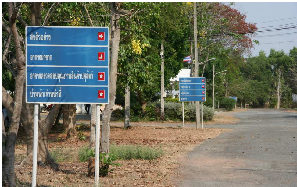
มีป้ายบ่งชี้ เส้นทางจราจรภายใน ศูนย์วิจัยและพัฒนาการสัตวแพทย์ภาคตะวันออกเฉียงเหนือตอนล่าง