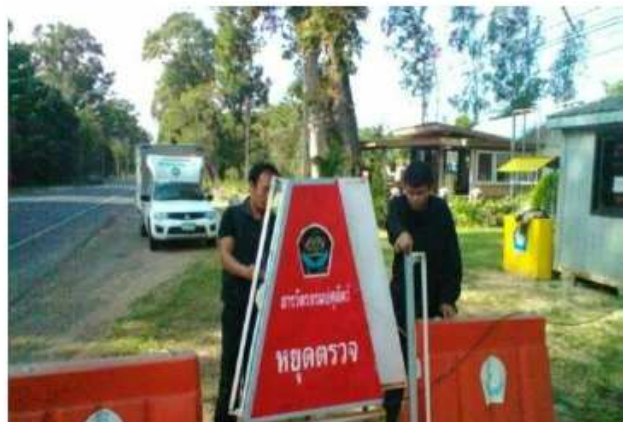
ตรวจสอบบำรุงรักษา อุปกรณ์ เครื่องมือ เครื่องใช้ ให้อยู่ในสภาพที่ปลอดภัยและพร้อมใช้งานอยู่เสมอ ด้านกักกันสัตว์ไฮสโตร