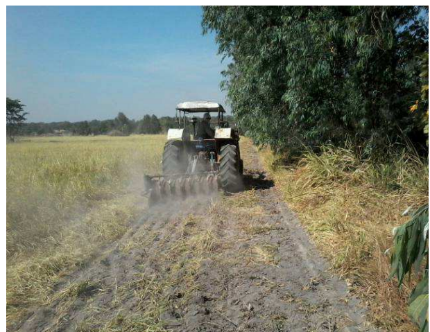
ทำแนวป้องกันไฟฟ้า สถานีวิจัยทดสอบพันธุ์สัตว์นครสวรรค์