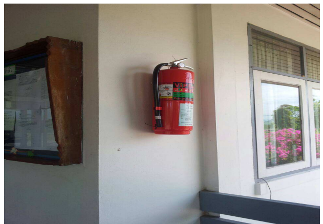
ติดตั้งถังดับเพลิงในบริเวณที่เป็นจุดเสี่ยง สถานีพัฒนาอาหารสัตว์ชุมพร