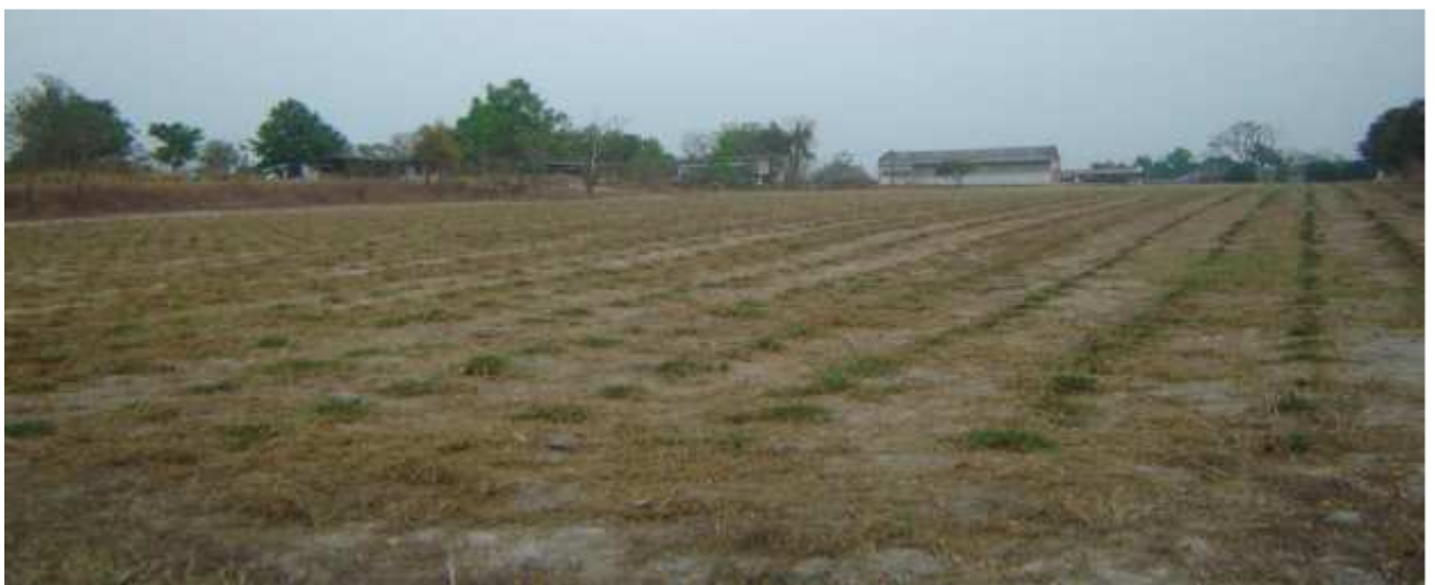
ทำความสะอาดแปลงพืชอาหารสัตว์ หลังการเกี่ยวเมล็ดพันธุ์ ศูนย์วิจัยและพัฒนาอาหารสัตว์ลำปาง