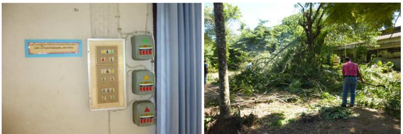
ตรวจสอบวัสดุอุปกรณ์ไฟฟ้า และตัดแต่งกิ่งไม้ที่มีสายไฟพาดผ่านเพื่อป้องกันอันตราย สำนักงานปศุสัตว์จังหวัดตรัง