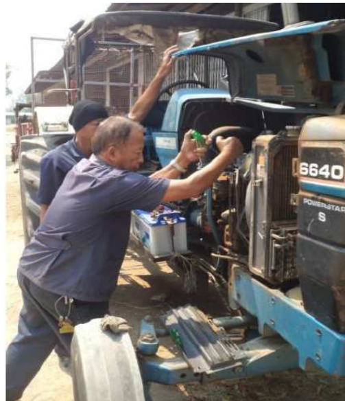
การดูแลบำรุงรักษารถยนต์ รถแทรกเตอร์ และอุปกรณ์ฟาร์ม ศูนย์วิจัยและบำรุงพันธุ์สัตว์ตาก