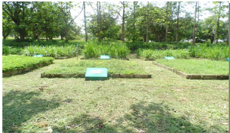
จัดการแปลงพืชอาหารสัตว์ให้สะอาด เพื่อป้องกันไฟป่าลุกลาม