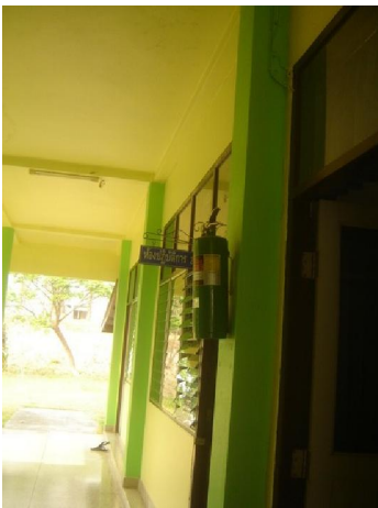
ติดตั้งเครื่องดับเพลิงไว้ทุกอาคาร