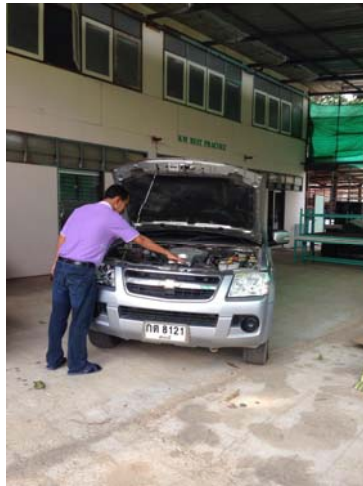
ตรวจสอบเช็คสภาพรถยนต์