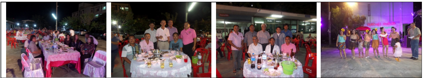
สำนักงานฯ ได้จัดกิจกรรมวันส่งท้ายปีเก่าต้อนรับปีใหม่ ปี ๒๕๕๘