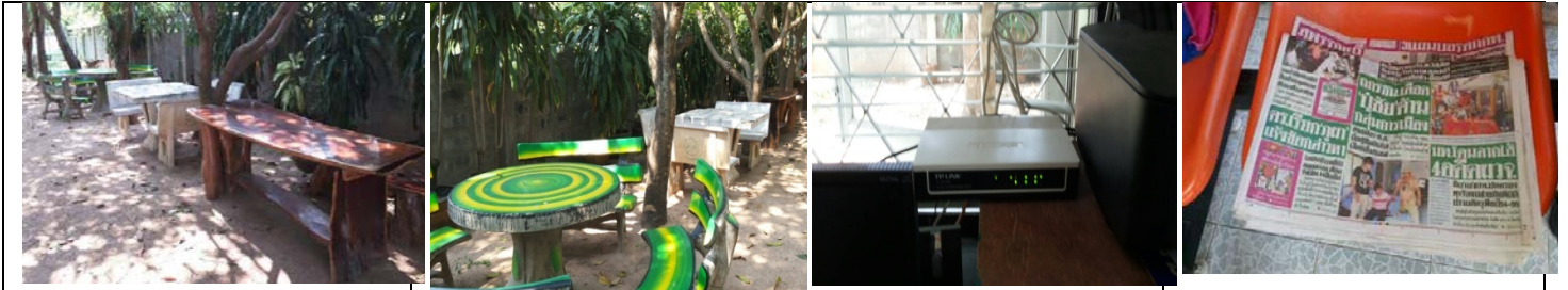
สำนักงานฯ ได้จัดสถานที่พักผ่อนจากการทำงานพร้อมทั้งติดตั้งสัญญาณอินเทอร์เน็ตไร้สายและจัดโต๊ะรับประทานอาหารกลางวัน