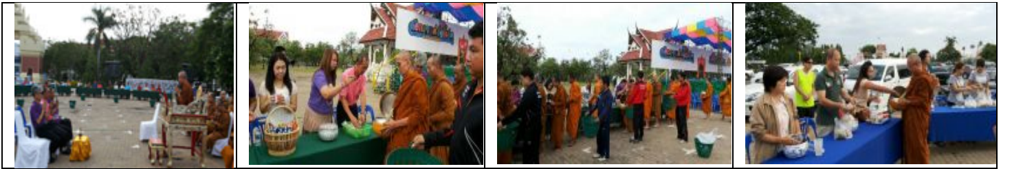
สำนักงานฯ ได้ร่วมโครงการตักบาตรทุกวันอาทิตย์ โดยร่วมกับหน่วยงานที่เป็นเจ้าภาพในอาทิตย์นั้นๆ