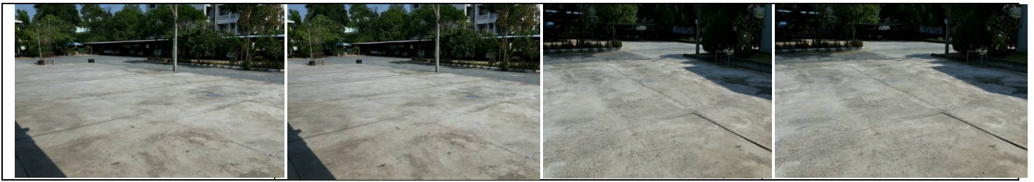
สำนักงานฯ ได้จัดกิจกรรมลานเอนกประสงค์ไว้ให้บุคลากรออกกำลังกายหลังจากเลิกปฏิบัติงาน