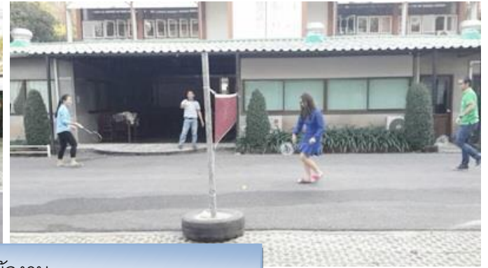
ภาพแสดง > มีการจัดสถานที่เพื่อออกกำลังกายบริเวณหลังสำนักงาน