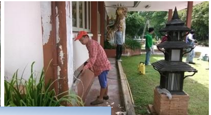
ภาพแสดง > ทำความสะอาดเสาและผนังบริเวณหน้าสำนักงานฯ