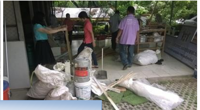
ภาพแสดง > ทำความสะอาดถนนรอบบริเวณสำนักงานฯ