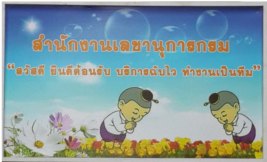
ภาพที่ 1 ติดแผ่นป้าย “สวัสดิ ยินดีต้อนรับ บริการฉับไว ทำงานเป็นทีม”