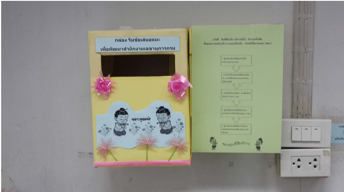
ภาพที่ 3 กล่องรับข้อคิดเห็น