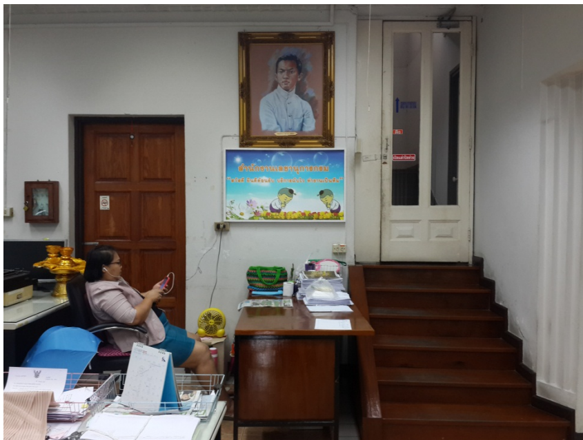
ภาพที่ 2 ติดแผ่นป้าย “สวัสดิ ยินดีต้อนรับ บริการฉับไว ทำงานเป็นทีม”