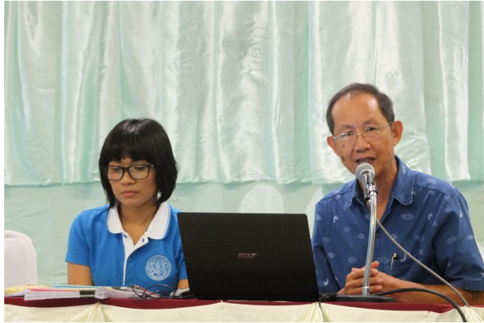
การสัมมนาและชี้แจงมาตรฐานการผลิตหญ้าแพงโกลาตามมาตรฐานการปฏิบัติทางการเกษตรที่ดี (GAP) สำหรับหญ้าแพงโกลา