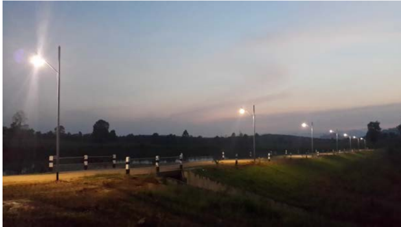
การปรับภูมิทัศน์ภายในศูนย์วิจัยฯ และสถานีฯ