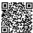
QR Code ใบสมัคร