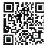
QR-Code ประกาศรับสมัคร

หมายเหตุ : ผู้ที่ไม่มีสิทธิได้รับการเสนอชื่อและได้รับการคัดเลือก คณะกรรมการสิทธิมนุษยชนแห่งชาติ (กสม.) คณะทำงานพิจารณาคัดเลือก ประจำปี 2565 และเจ้าหน้าที่ของสำนักงาน กสม.