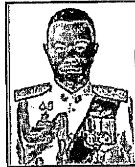
พลตำรวจเอก ณัฐธร เพระาสุนทร (ด้านอื่น ๆ ที่จะยังประโยชน์ต่อการปฏิบัติหน้าที่ ของ กสทช. (ด้านกฎหมาย))