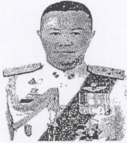
๕. พลตำรวจเอก ธีรยุทธ เพระาสุนทร อดีตที่ปรึกษาพิเศษ สำนักงานตำรวจแห่งชาติ