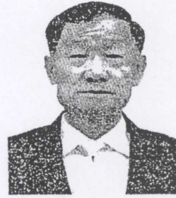
๖. พลเรือเอก ประสาน สุขเกษตร อดีตรองผู้บัญชาการทหารสูงสุด