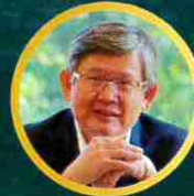
Dr. Suvit Maesincee Former Minister of Ministry of Higher Education, Science, Research and Innovation