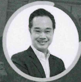
WETANG PHUANGSUP Econ Ph.D. 1999, Ministry of Digital Economy and Society