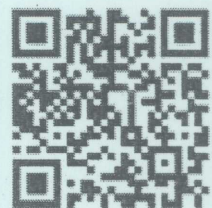
สแกน QR Code