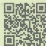
สแกน QR Code